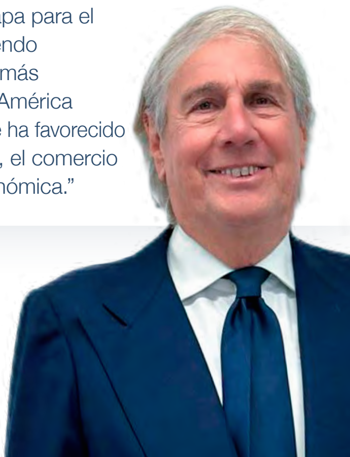
LUCIANO MAROCCHINO PRESIDENTE

“Recientemente tuve la oportunidad de participar y dirigir unas palabras en el Parlamento Europeo. En esa ocasión me referí al escenario político y económico que atraviesa Chile y al interés con que Europa observa esta nueva etapa para el país. Señalé que Chile continúa siendo percibido como uno de los países más estables, seguros y previsibles de América Latina, condición que históricamente ha favorecido la atracción de inversión extranjera, el comercio internacional y la cooperación económica.”